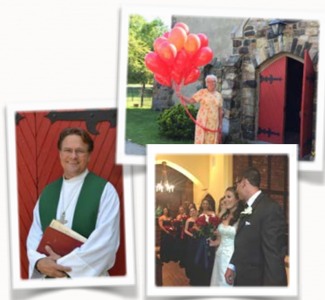
Nuestra puerta está siempre abierta; y seguimos la regla de San Benito: la bienvenida a todos la